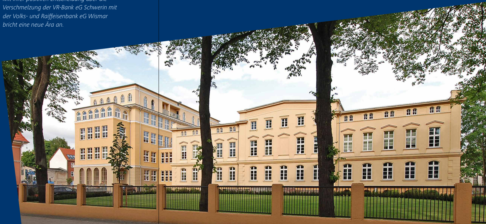
Ihr Willi Plum

Sie alle haben es sich verdient, Teil einer weiterhin erfolgreichen VR-Bank Mecklenburg eG zu sein.